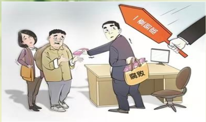
漫画/周盼 作者/韩思宁

黑龙江省纪委监委通报10起侵害群众利益不正之风和腐败问题典型案例，辽宁省营口市纪委监委通报3起群众身边腐败和作风问题典型案例，湖北省武汉市黄陂区纪委监委通报1起侵害群众利益典型案例……近日，多地通报查处侵害群众利益的典型案例。